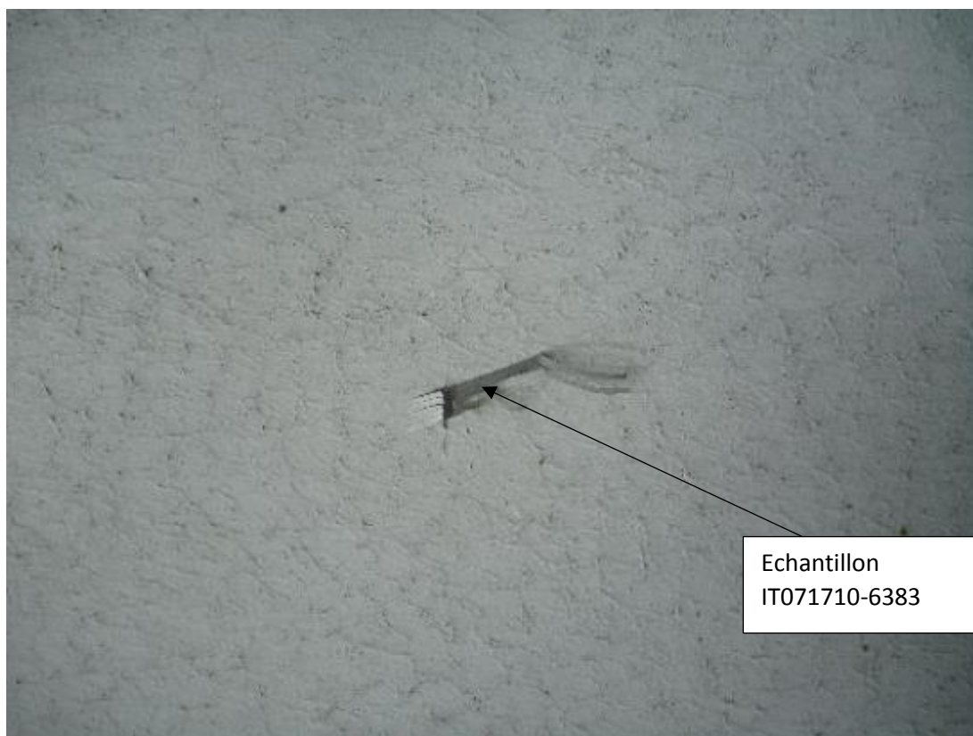
Prise d'échantillon enduit façade immeuble Estienne