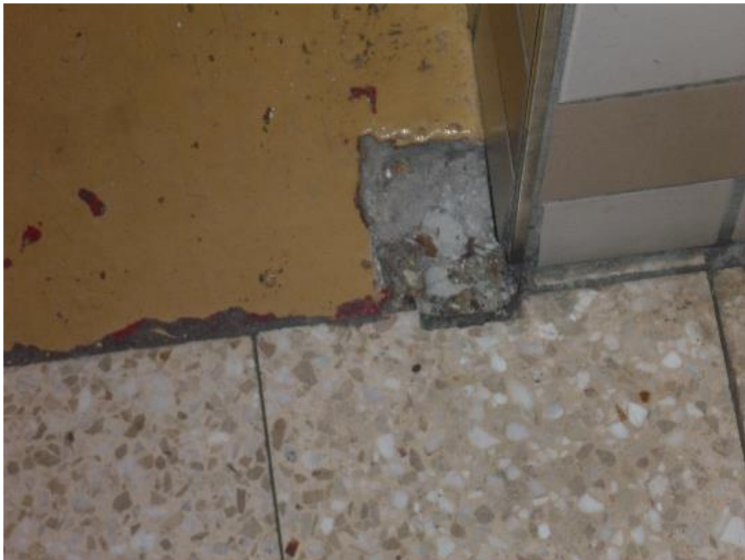
Prise d'échantillon revêtement de sol palier accès escalier RDC