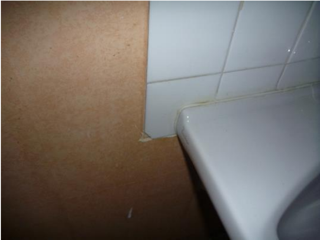
Prise d'échantillon colle faïences murales salle de bains