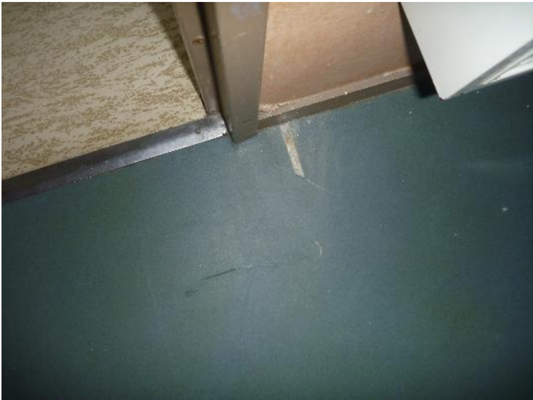
Prise d'échantillon sols souples toilettes et salle de bains