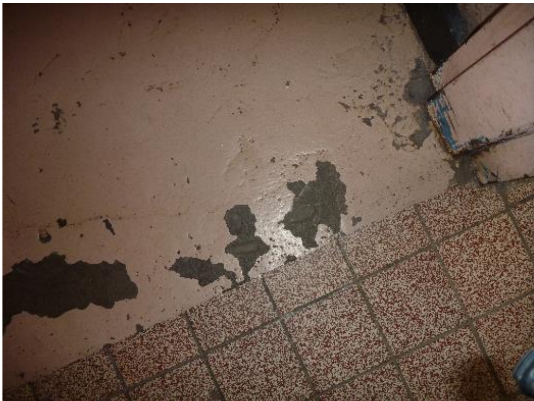
Prise d'échantillon revêtement de sol palier d'accès escalier RDC Florian