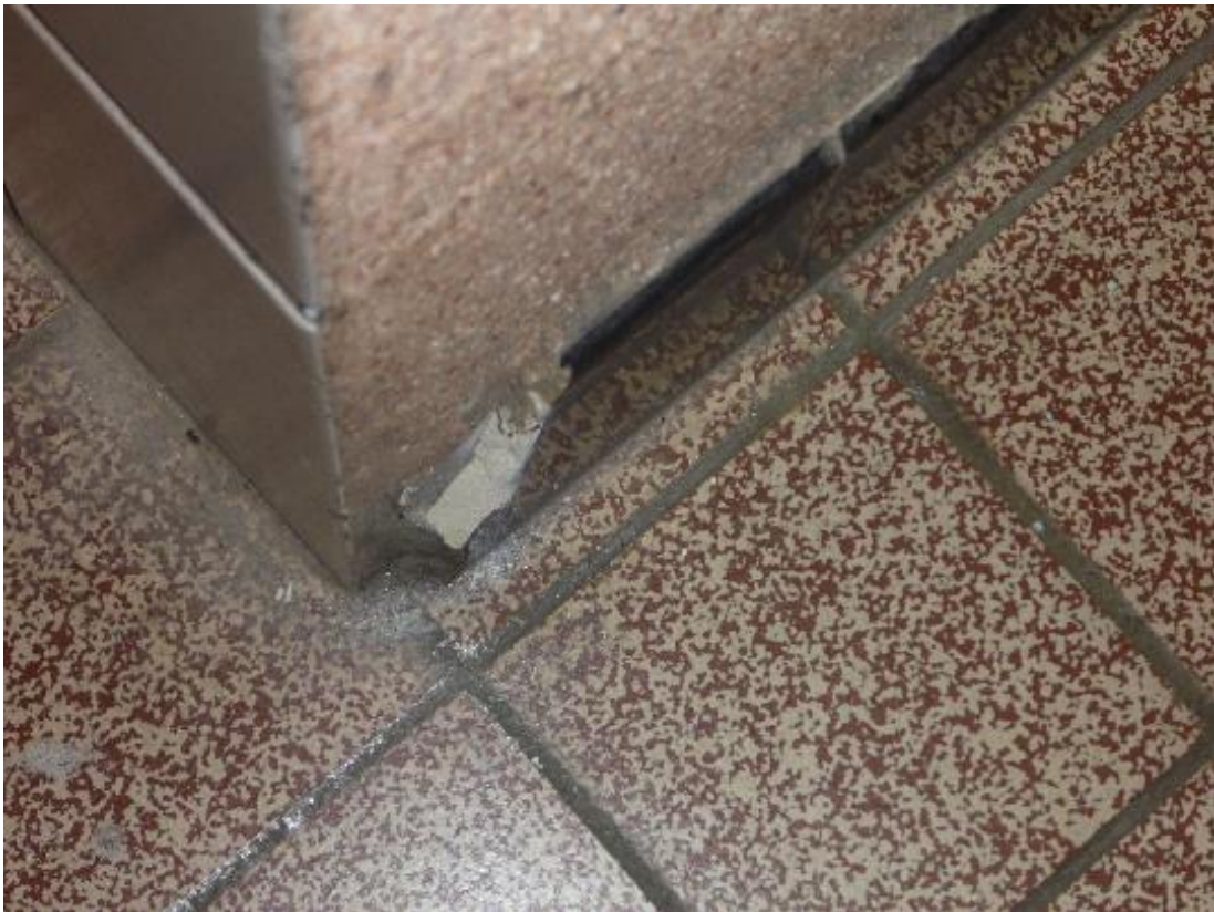
Prise d'échantillon colle plinthes carrelage sol entrée Florian