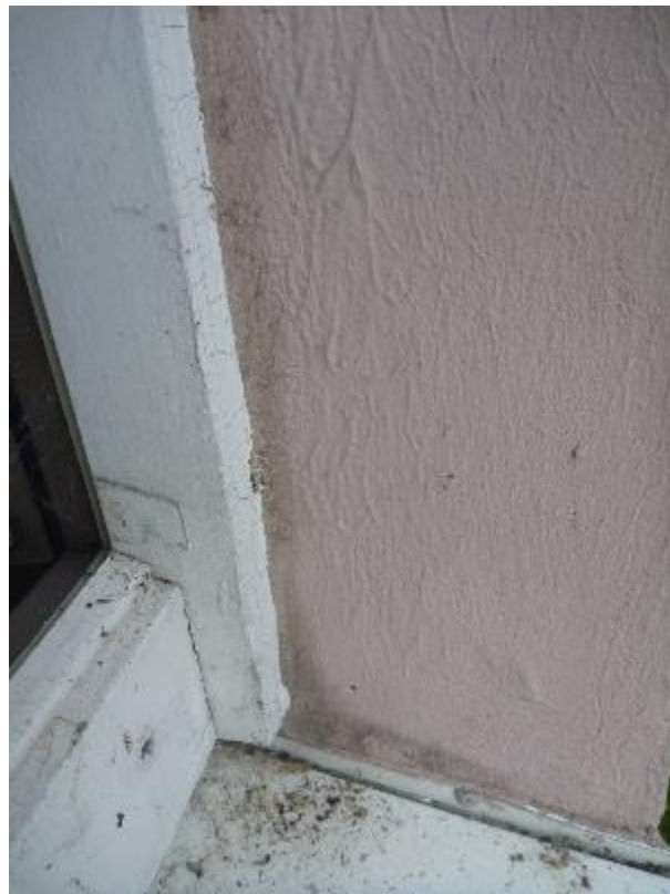
Prise d'échantillon joint bâti/maçonnerie menuiseries extérieures