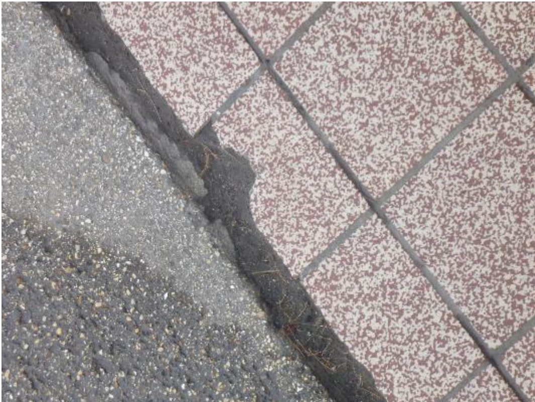
Prise d'échantillon colle carrelage sol porche d'entrée extérieur Florian