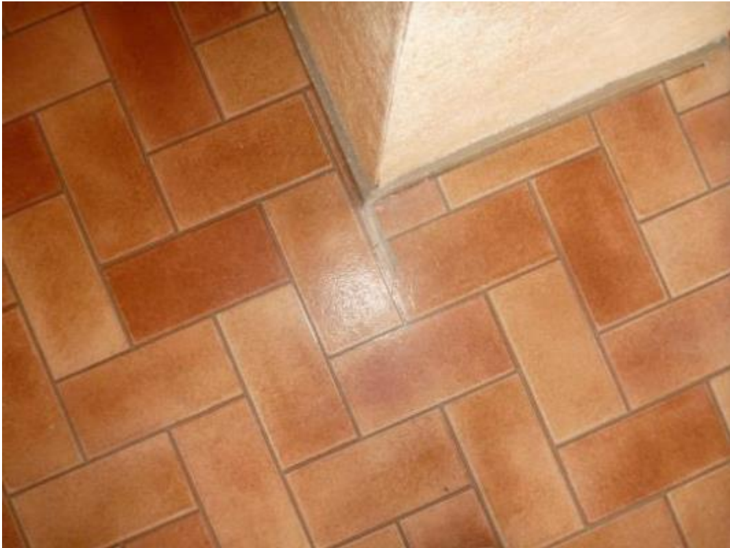
Prise d'échantillon sol souple salle de séjour