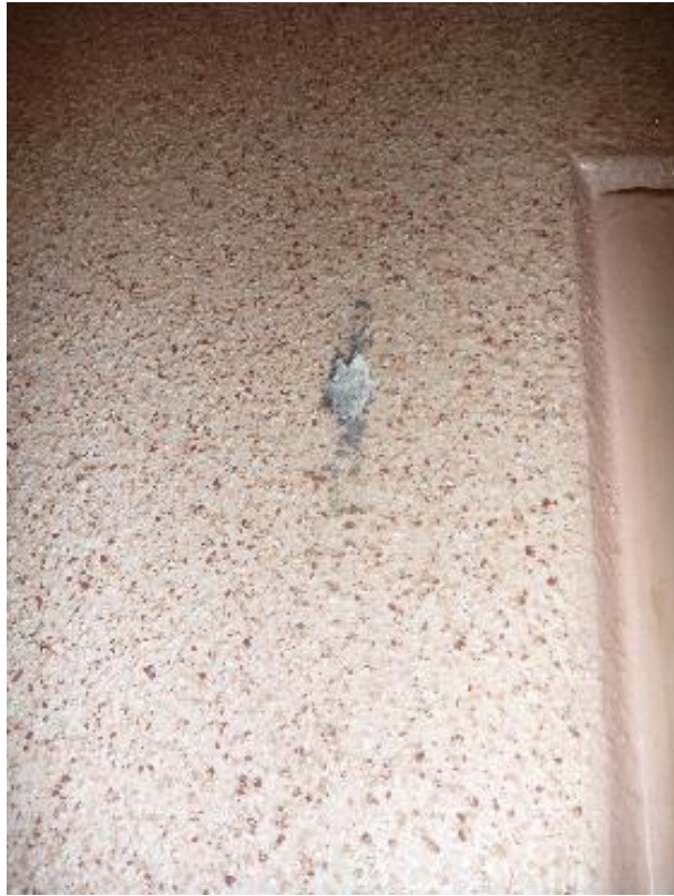
Prise d'échantillon revêtement mural parties communes RDC Florian