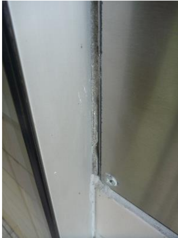
Prise d'échantillon joint bâti/maçonnerie portier d'entrée Lemar A