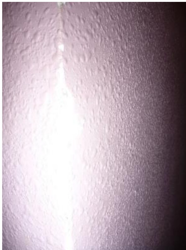
Prise d'échantillon peinture murs parties communes 2ème étage Lemar A