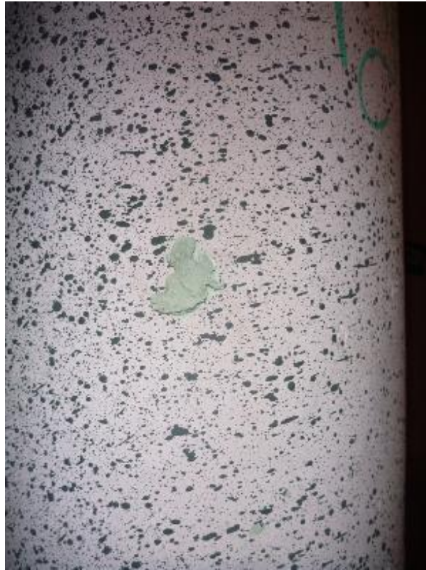
Prise d'échantillon revêtement mural cage d'escalier Lemar A