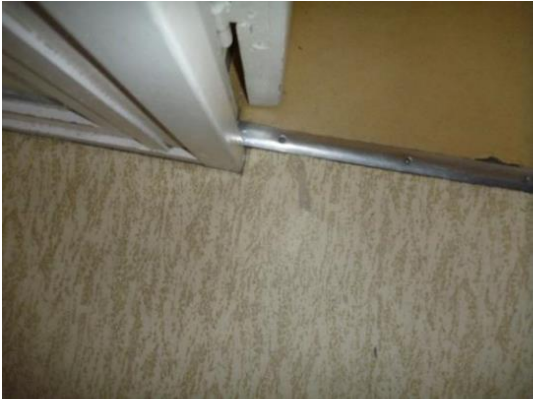
Prise d'échantillon sols souples couloir + 3 chambres