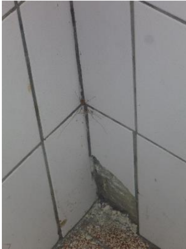
Prise d'échantillon colle faïences murales porche d'entrée extérieur Florian