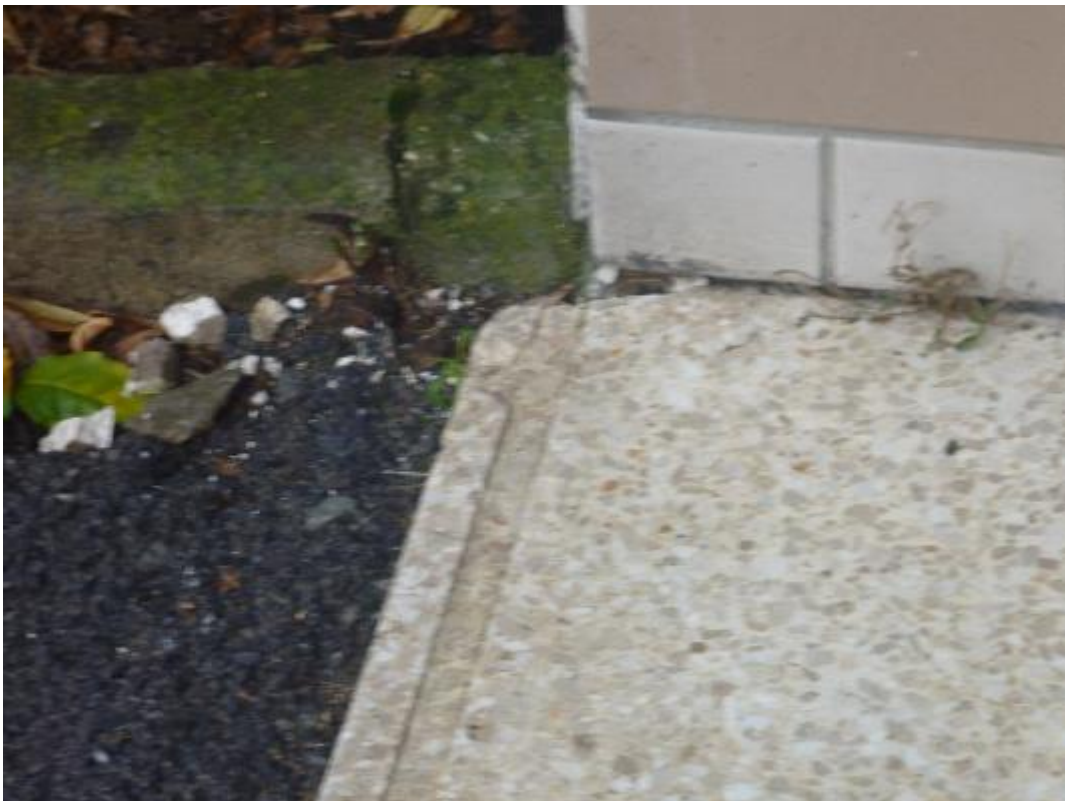
Prise d'échantillon colle carrelage sol hall d'entrée Lemar A