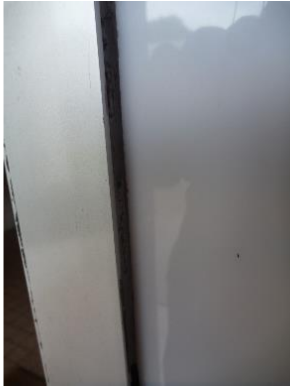
Prise d'échantillon joint bâti/maçonnerie portier d'entrée Florian