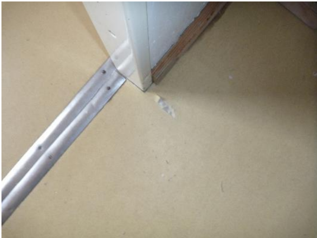
Prise d'échantillon sols souples cuisine + local cumulus