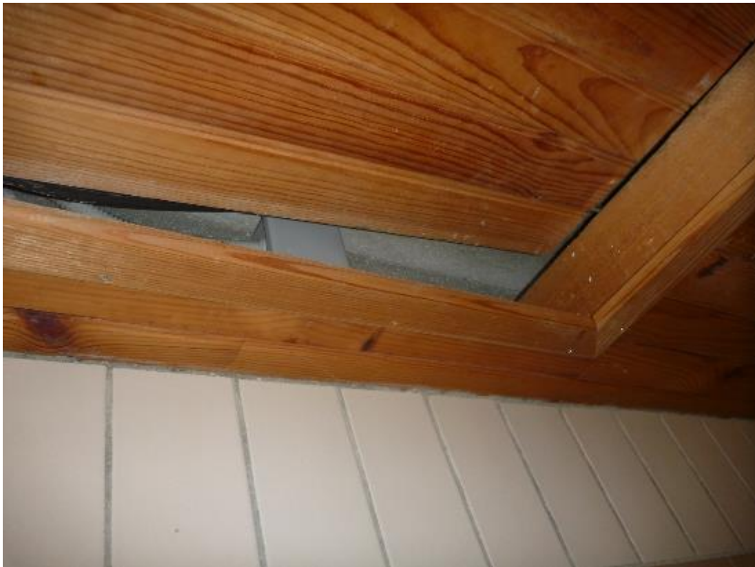
Lambris au plafond des circulations Lemar A RDC