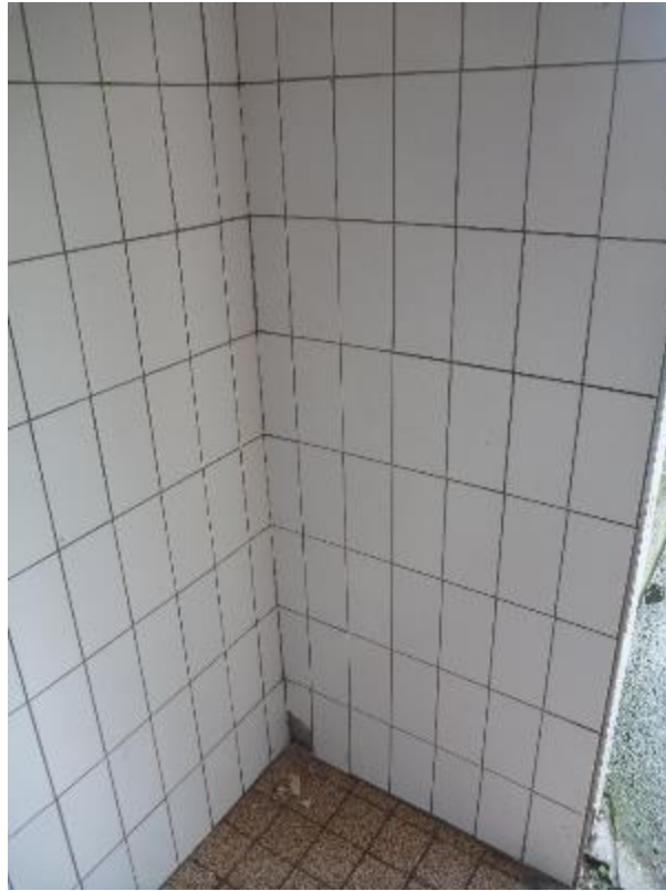
Faïences murales porche d'entrée extérieur Florian