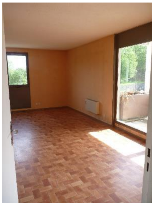
Salle de séjour