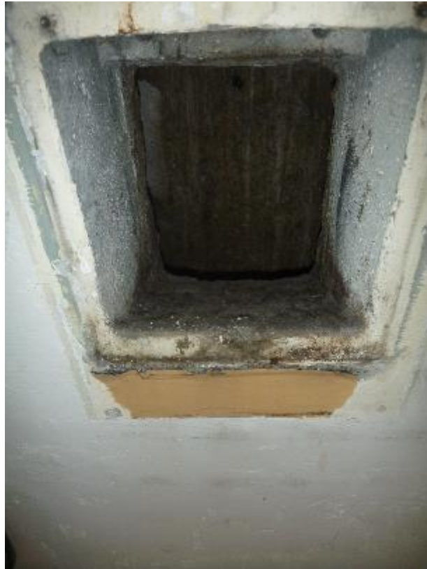
Gaine technique VMC