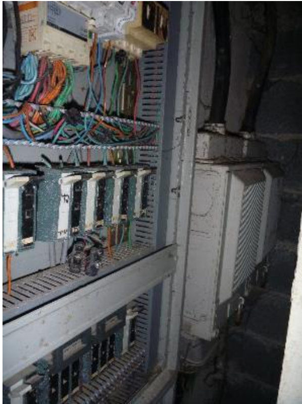
Gaine technique courants faibles et forts Lemar A RDC