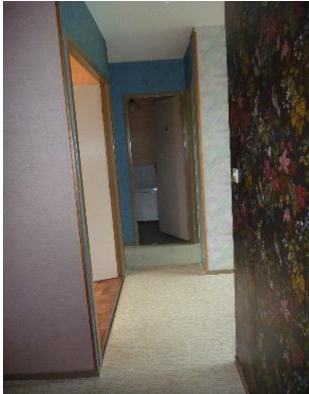
Couloir de desserte