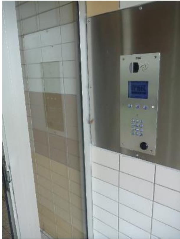
Portier d'entrée Lemar A