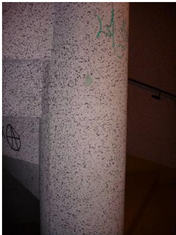
Revêtement mural cage d'escalier Lemar A