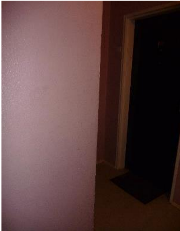
Peinture murs parties communes 2ème étage Lemar A