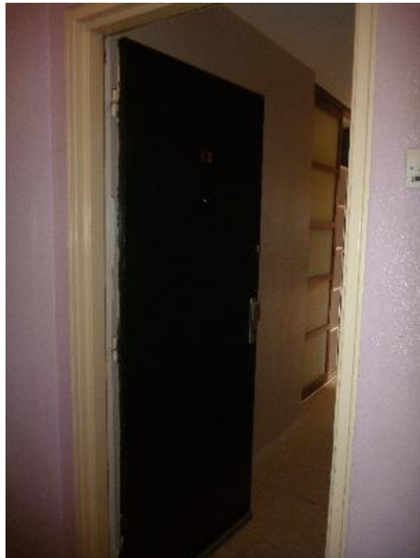
Appartement 24 Lemar B