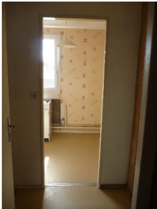
Couloir de desserte