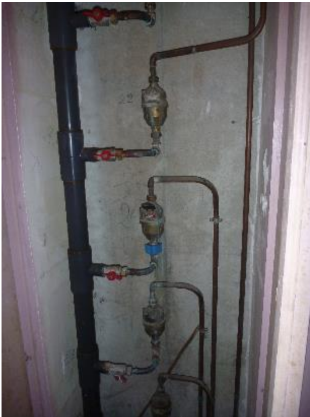
Gaine technique eau 2ème étage Lemar A