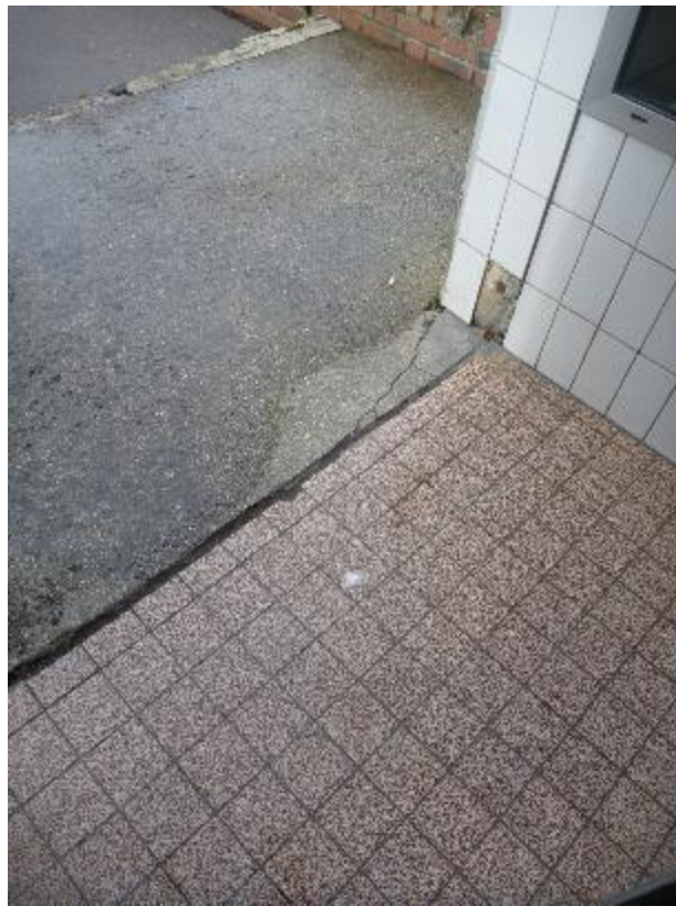
Carrelage sol porche d'entrée extérieur Florian