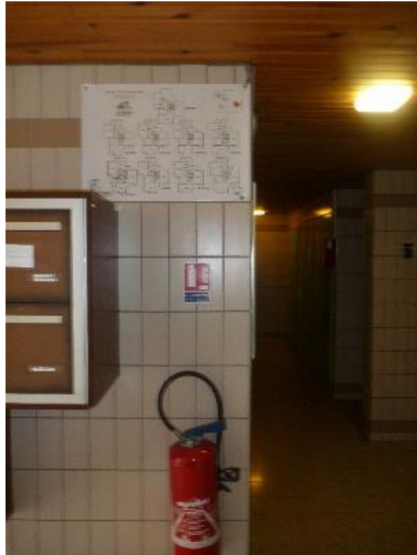
Faïences murales parties communes RDC Lemar A