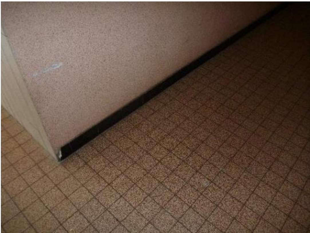
Plinthes carrelage sol entrée Florian