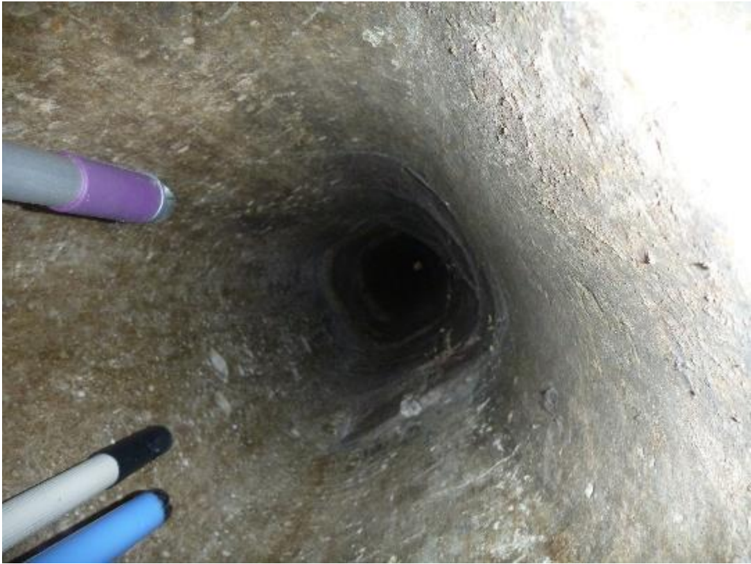
Vide ordure Lemar A