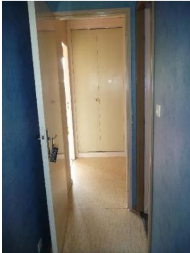
Couloir de desserte