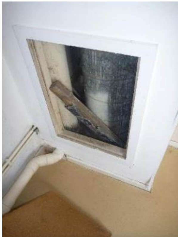
Gaine technique VMC