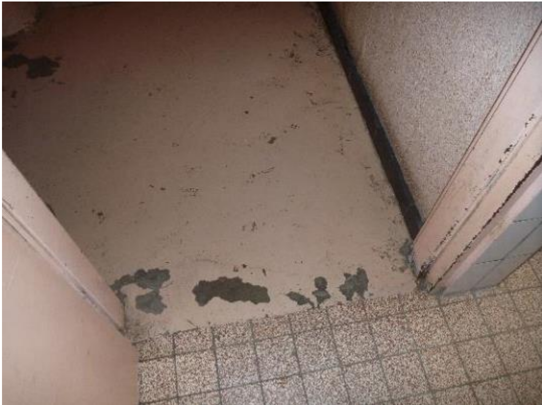
Revêtement de sol palier d'accès escalier RDC Florian