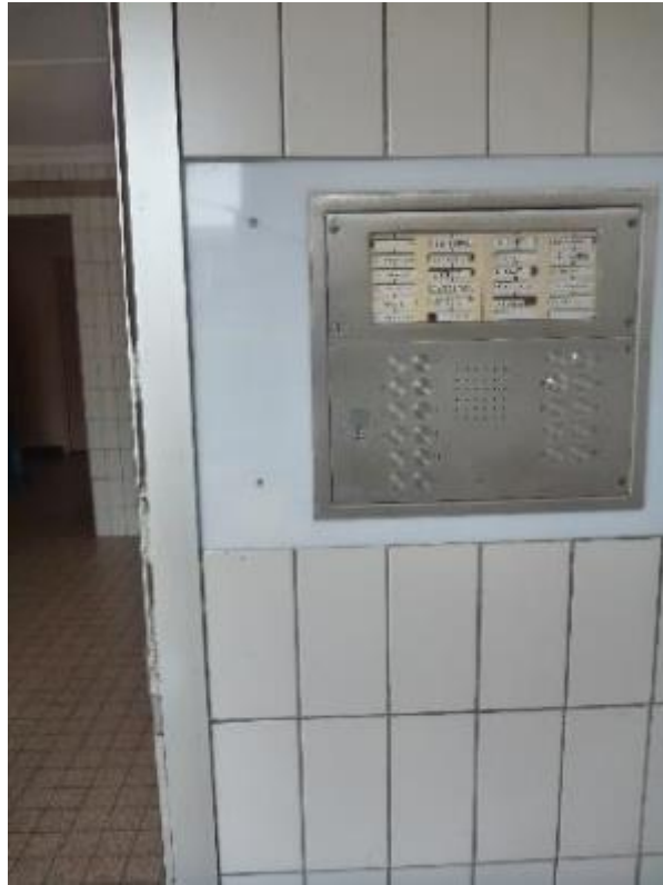
Portier d'entrée Florian