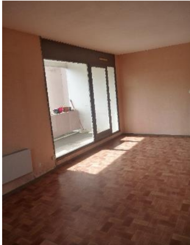
Salle de séjour