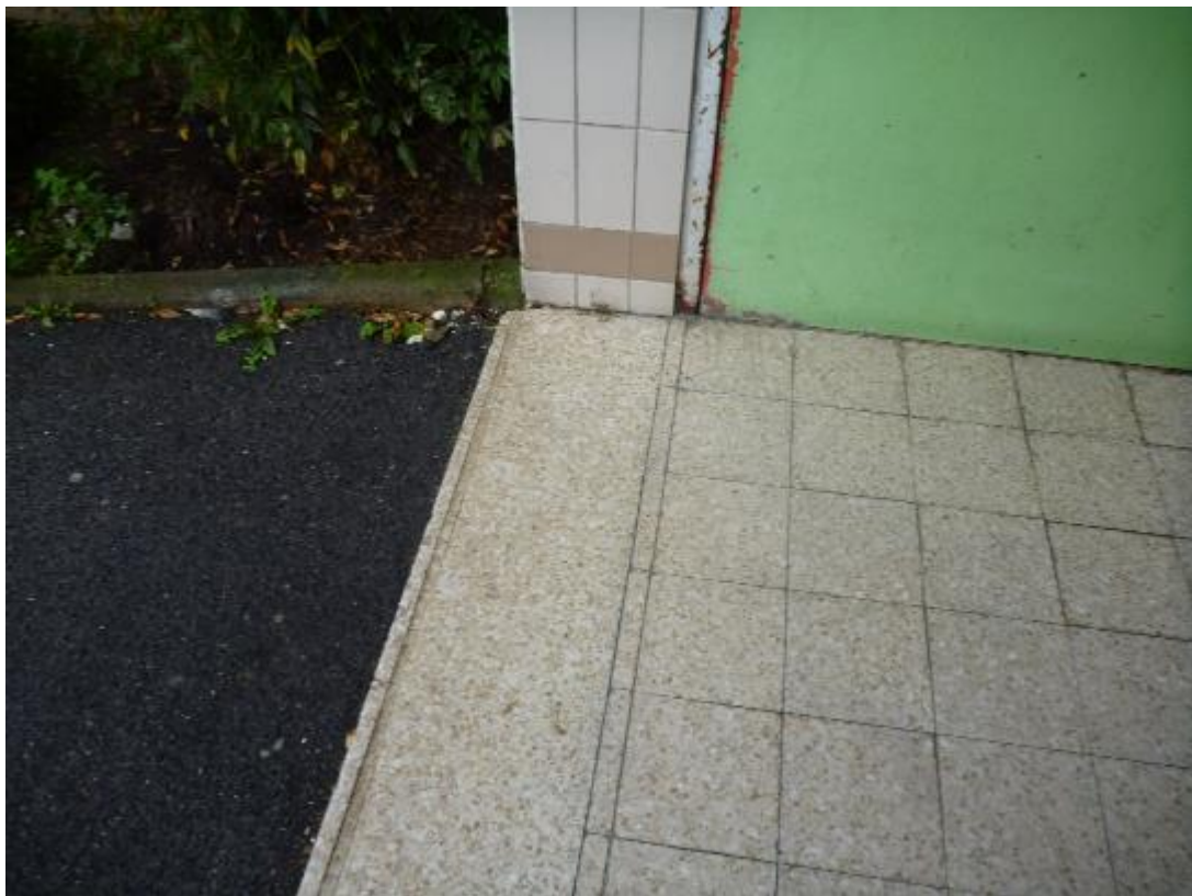
Carrelage sol hall d'entrée Lemar A