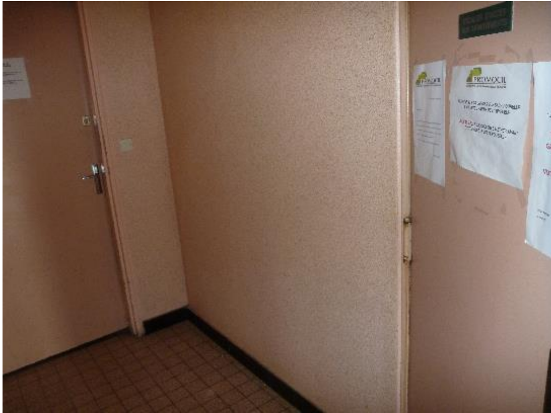
Revêtement mural parties communes RDC Florian