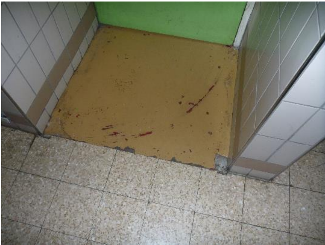
Revêtement de sol palier accès escalier RDC