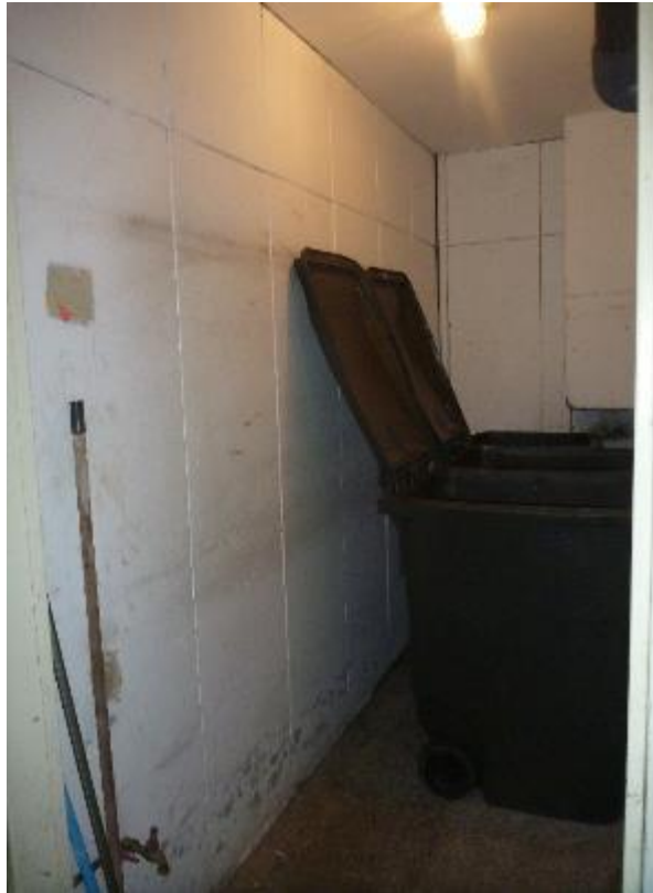
Local poubelles RDC Lemar A